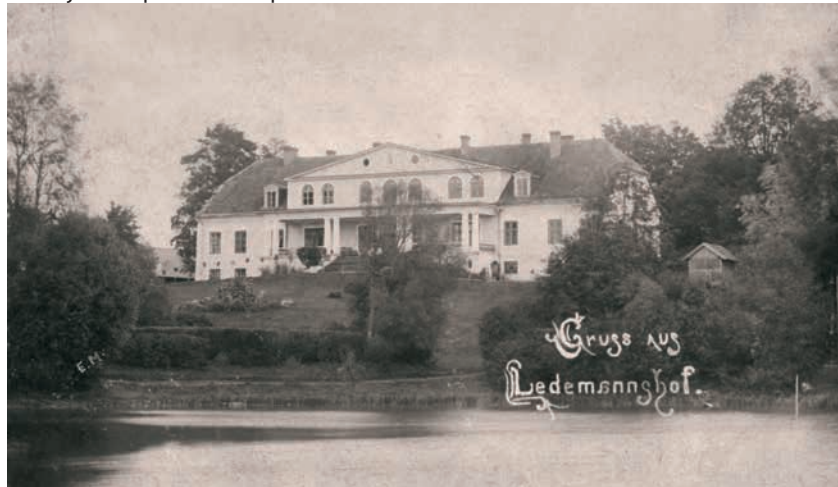
Lēdmanes muižas pils.

Pētījums top ar Kultūrkapitāla fonda atbalstu.