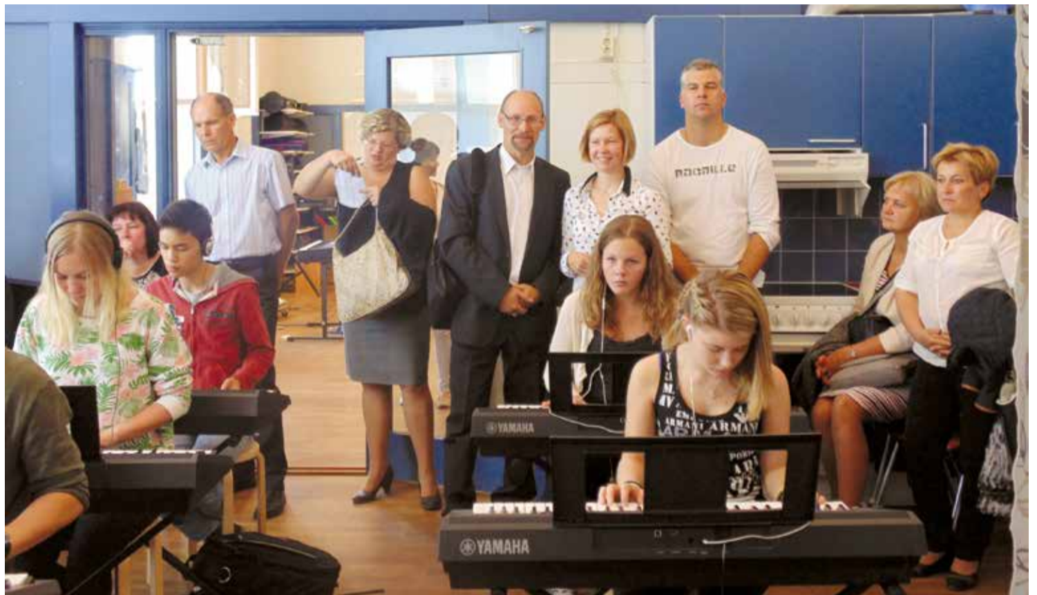
Lielvārdes novada pašvaldības pārstāvji un izglītības iestāžu vadītāji, guva jaunus iespaidus, vērojot inovatīvas mācību metodes, plānojot efektīvu mācību procesu. Lasiet 5. lpp.