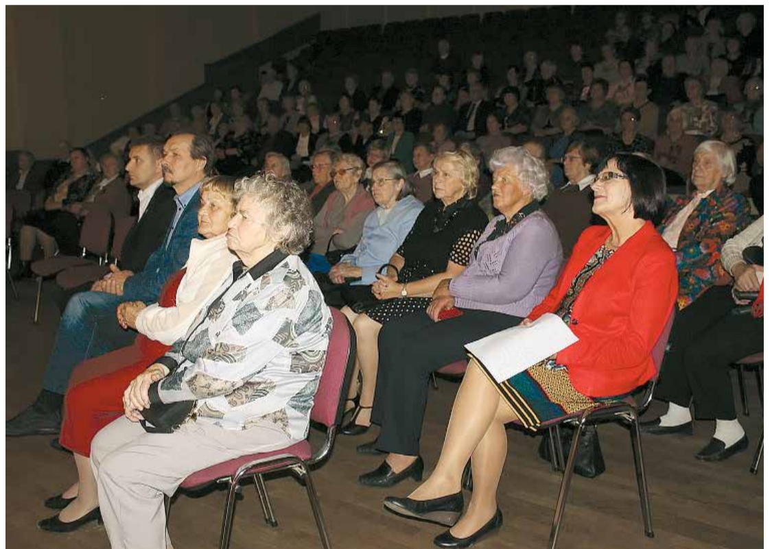
Lielvārdes novada seniori varēja vērot priekšnesumus un baudīt uzmundinājuma vārdus.