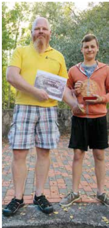
Uzvarētāji - komanda Rudās lapsas.

Solvita Šmite Tūrisma speciāliste Lielvārdes novada pašvaldībā