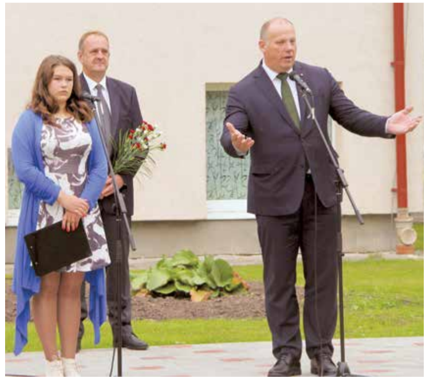
Skolēnus uzrunā aizsardzības ministrs Raimonds Bergmanis.

Lielvārdes pamatskolā kopš 2017. gada aprīļa ir nodibināta jaunsardzes vienība. Vienlaikus Lielvārdes pamatskola ir Lielvārdes militārā lidlauka tuvākais civilais kaimiņš, ar kuru Nacionālo bruņoto spēku Gaisa spēkiem izveidojusies cieša sadarbība.