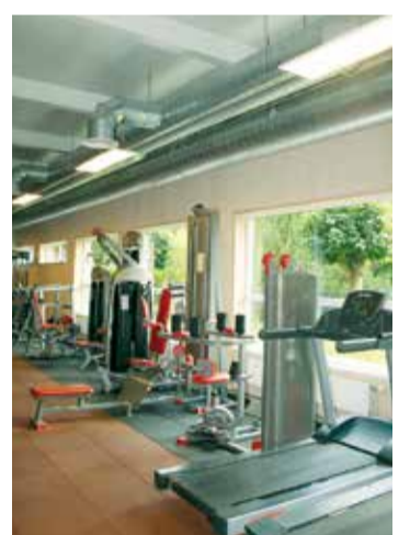
Sporta centra treniņu zāle.

bībā ar Lielvārdes novada pašvaldību izveidots multifunkcionālais laukums pie sporta centra, kas jau iemantojis lielu popularitāti, visu vasaru un arī tagad, rudenī, laukums tiek izmantots tenisa spēlei.