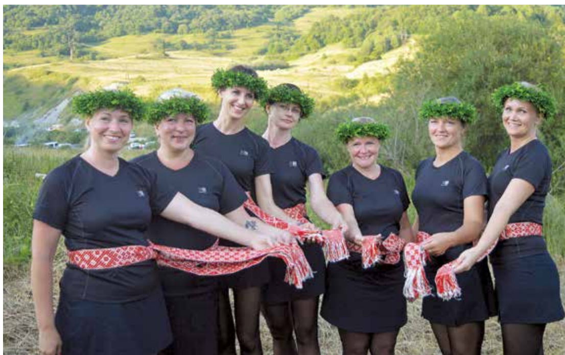
Lielvārdes jostu apjostās meitenes Gruzijas kalnos.

Ja latvietis ierastos Gruzijā ar savu auto, iespējams, viņš nekur tālu netiktu. Gruzijā braukt ir jāmāk! Latvietis pirms manevra veikšanas varētu pieklājīgi rādīt pagrieziena, kamēr izdeg lampiņa. Te, lai paziņotu citiem satiksmes dalībniekiem par savu nodomu, tiek signalizēts. Braukšanas ātrums apdzīvotā vietā mēdz sasniegt 140 km/h. Latvietim tādā reizē acu priekšā tiek uzburtas aina ar nejausi izskrējušu bērnu uz