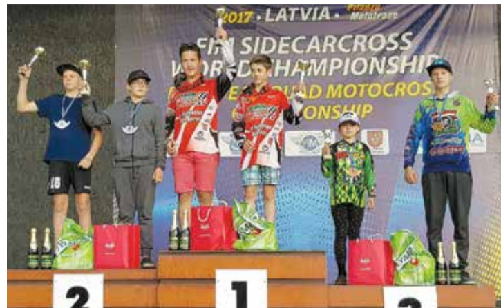
Pirmās vietas ieguvēji brāļi Tilaki Stelpes "Pīlādžu" mototrasē.