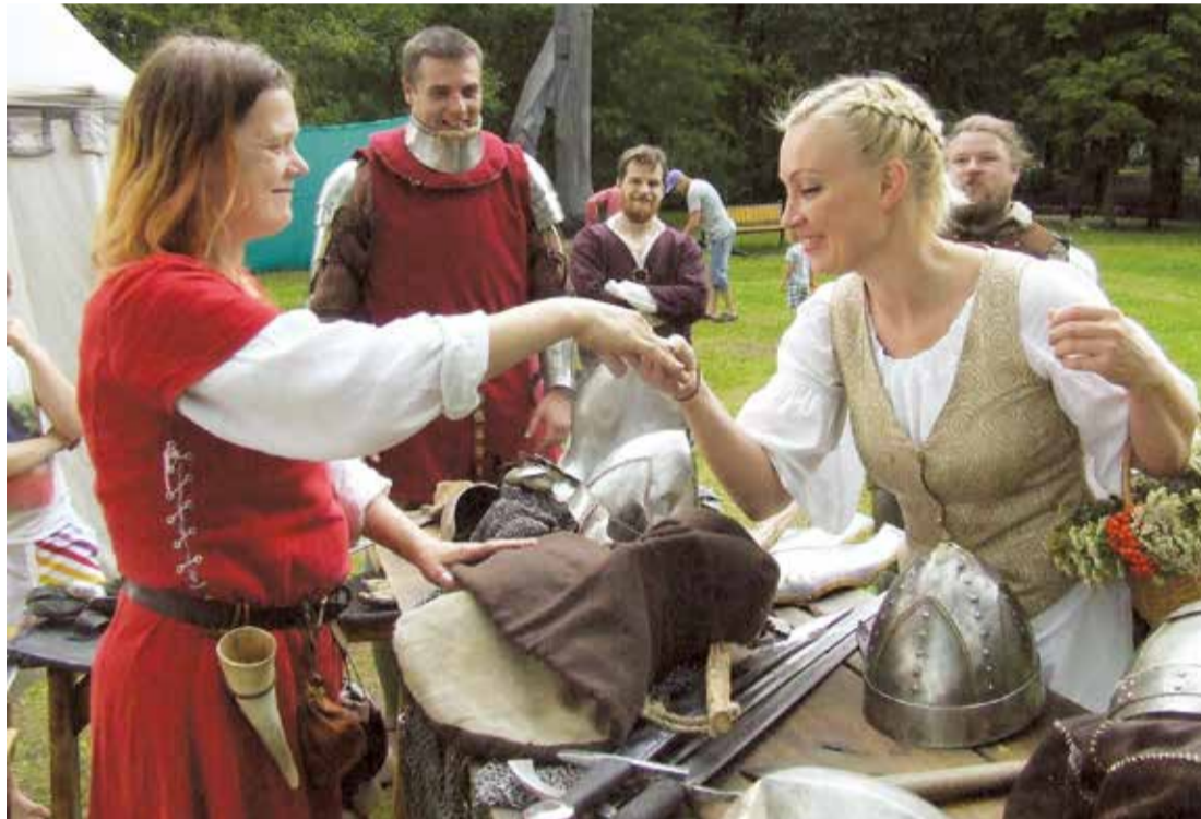
Bruņinieku biedrība "Exercitus Rigensis" mācīja rīkoties ar ieročiem, demonstrēja bruņinieku ciņas tērpus un rotas.

Svētku un prieka sajūtas vispirms rodas katra sirdī, tās nav nopēr-