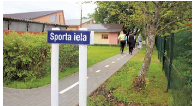
VPII „Zvaniņš” pagalmā bērni tagad var apgūt ceļu satiksmes noteikumus.