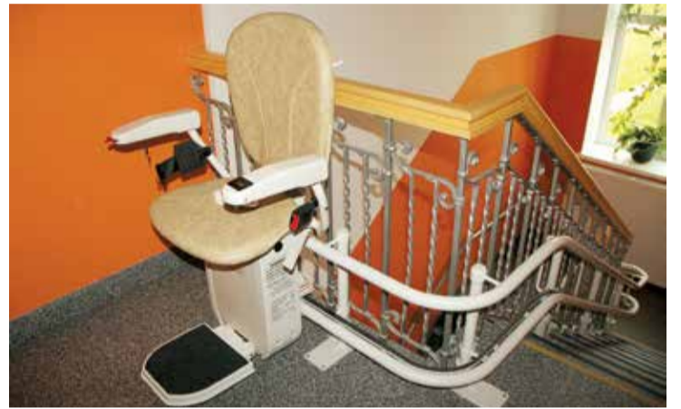
Jumpravas internātpamatskolā ir ierīkots pacelājs, lai atvieglotu pārvietošanos izglītojamiem ar kustību traucējumiem.