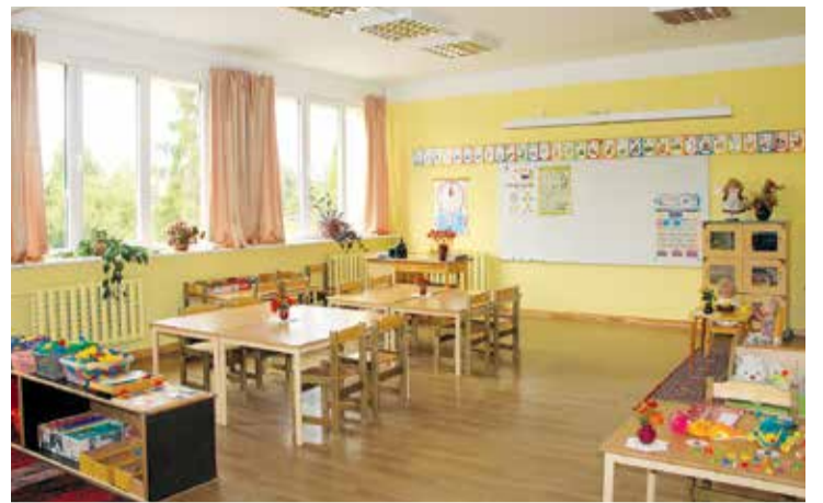
Lēdmanes pamatskolas sākumskolas klase.

Lielvārdes pamatskola sagaida ar jaunu, glītu žogu un krāšņām puķu dobēm. Šogad nobruģēti celiņi gar skolas fasādi apmēram 300m 2 platībā. Sagaidot jauno mācību gadu, daudz paveikts arī skolas telpās: veikts jumta remonts virs mūzikas kabineta, izremontēti gaiteni pirmsskolas un sākumskolas, uzstādīti jauni skapīši košās krāsās. Darbmācības kabinetā skolas direktors palepojas ar jauno metālapstrādes virpu, ar kuras palīdzību jaunieši varēs apgūt pirmās iemaņas metāla virpošanā, savukārt vienā no skolas gaitenītiem – ar savdabīgu „matemātisko dambreti”. Grīdas linoleja segumā iestrādāti šaha un dambretes lauciņi, bet vēl papildus lauciņi dod iespēju radoši apgūt reizrēķinu. Klases jau ir izrotātas ar apsveikumiem jaunajā mācību gadā un gaida mazos skolniekus. E. Kauliņa Lielvārdes vidusskolas