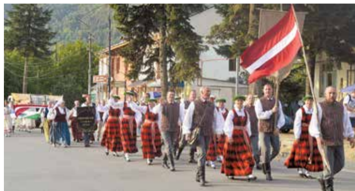
„Lāčplēsis” svētku gājienā.

Pēc kopīgajām pēckoncerta vakariņām ballītē tautu draudzība sit augstu vilni. Ballītes muzikālais izpildījums aprobežojas ar datoru un youtube, bet – kultūra vieno jebkurā gadījumā. Ne jau formai ir nozi-