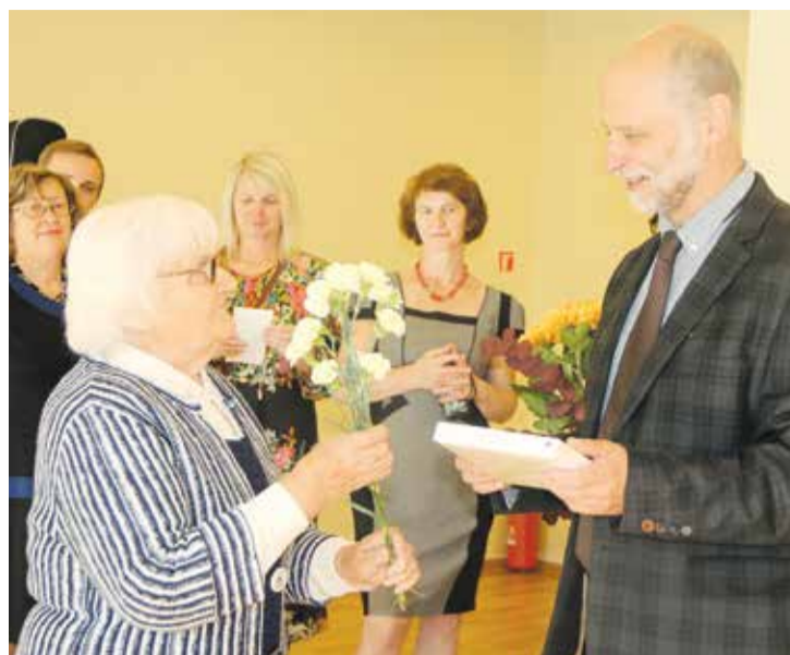
mēs dzīvosim savā zemē un dziedāsim mūsu tautasdziesmas! Mēs būsim!” ✘